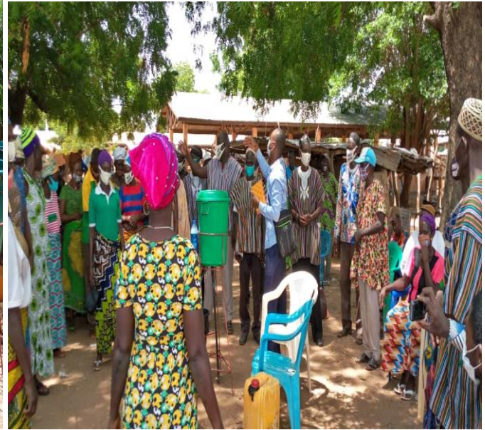
Sensibilisation au marché de Dapaong