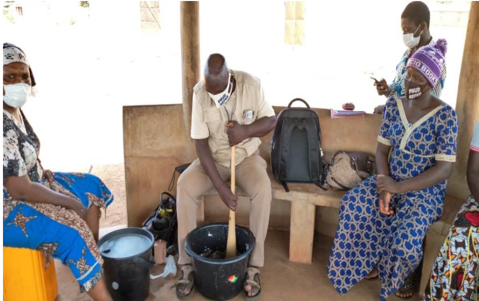
Formation en fabrication de savon liquide à Naki- est