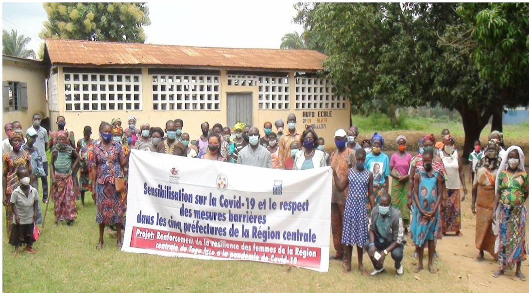
Photo de famille des participants à la sensibilisation sur la Covid 19 à Blitta