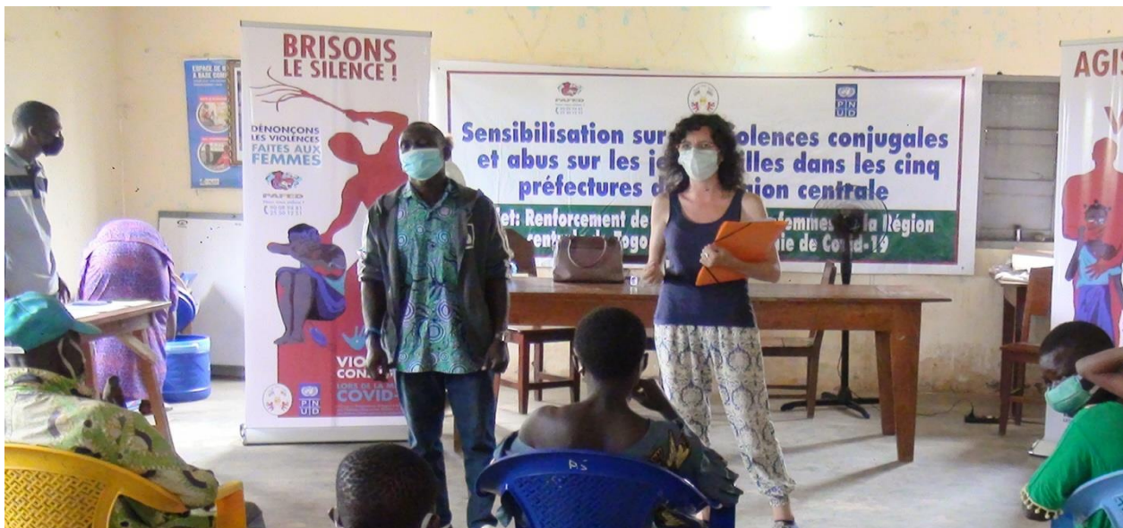
Photo prise lors de la sensibilisation sur les violences conjugales et abus sur les jeunes filles à Sotouboua

12. 10 émissions ont été réalisées à raison de 02 émissions par préfecture et par radio identifiée