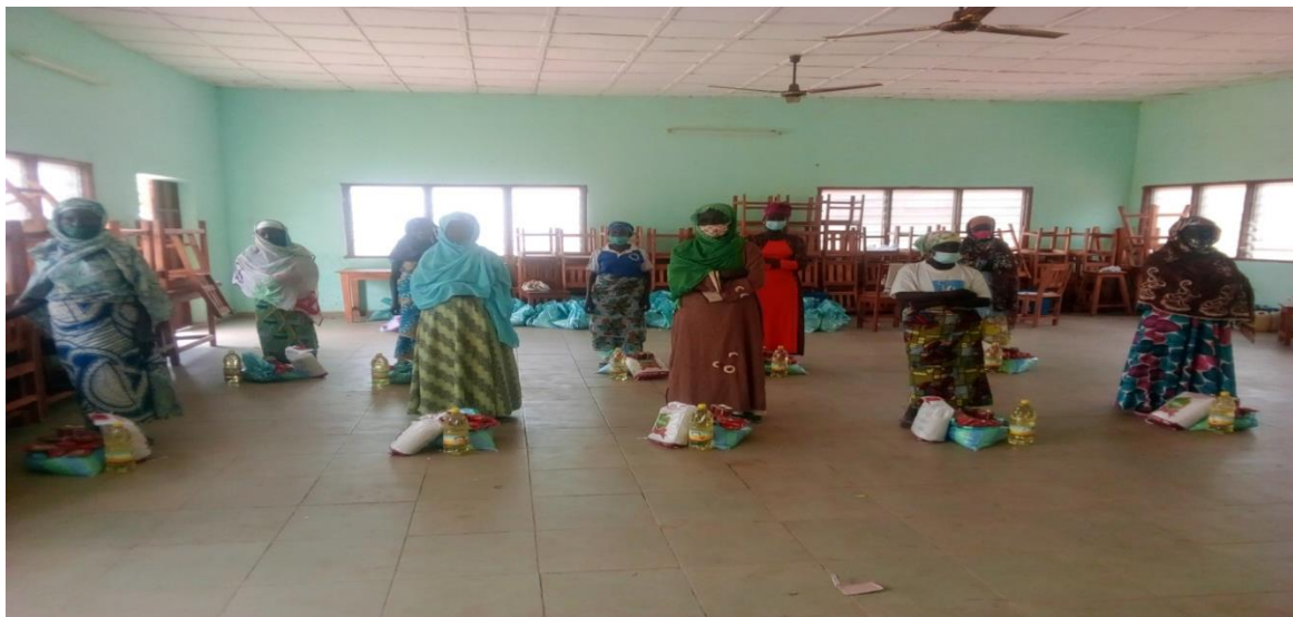
Photo des bénéficiaires de kits alimentaires à Djarkpanga dans la préfecture de Mô