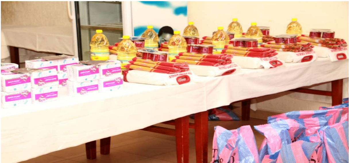
Photo des kits d'hygiène et kits alimentaires